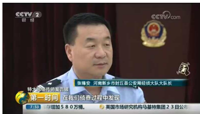
二〇一八全省第一大案技术支持