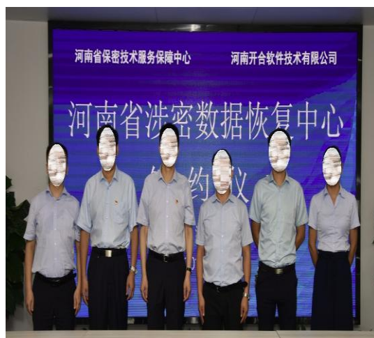
河南省国家保密局驻场服务单位