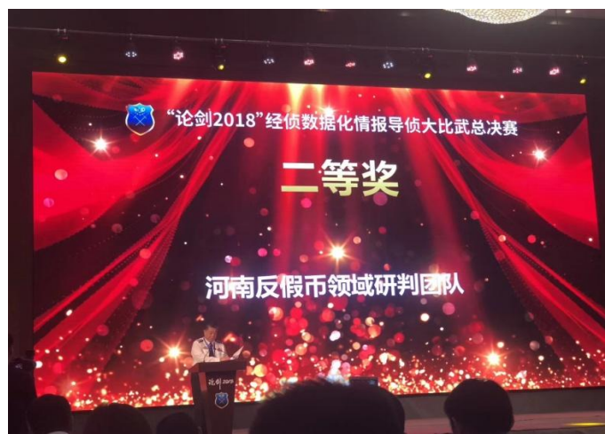
全国经侦实战大比武二等奖技术支持